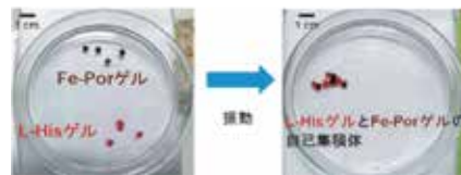
(図3)鉄ポルフィリンゲル(黒褐色)とL-ヒスチジンゲル(赤色染色)との自己集積体形成

ヘモグロビン、ペルオキシダーゼやシトクロム等では、タンパク質が補因子と複合体を形成することでそれぞれ酸素運搬、酸化還元酵素、電子伝達等の機能を発現しています。補因子である金属ポルフィリンとタンパク質中のあるアミノ酸との配位が重要な役割を担っています。生体由来の鉄ポルフィリンとアミノ酸(L-ヒスチジン)をそれぞれ人工高分子に導入したヒドロゲルを合成したところ、これらのヒドロゲルが配位結合により自己集積し、pH応答性の材料接着システムが構築できました(図3)。さらに最近では、タンパク質と補因子をそれぞれ導入したヒドロゲルを接着させたり離したりして補因子含有タンパク質の機能を制御する研究も行っています。